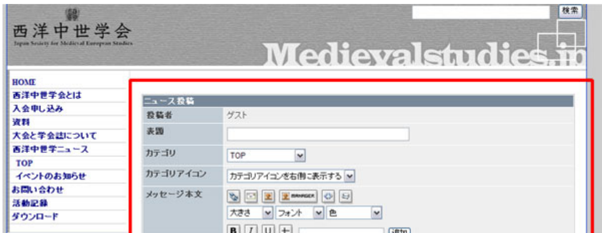
掲示板(BBS)的画面が表示される