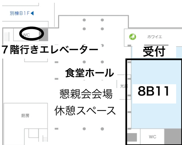
8号館地下1階教室配置図

・125周年記念ホール ポスターセッション 特別展示 書籍販売 ・特別会議室 報告者控室